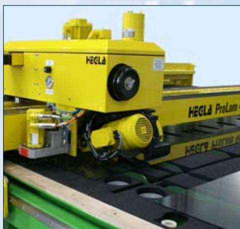
Optionnel: Pont d'émergence avec pont de coupe float