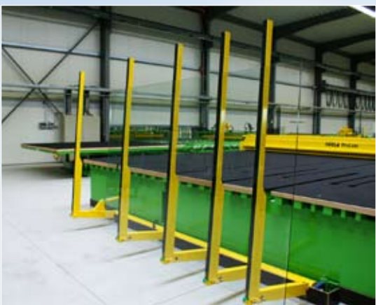
Bras de dépose (option)

La ProLam est une installation de découpe professionnelle pour la coupe flexible du verre feuilleté jusqu'à 6 m de long. Le module devant la table avec des courroies de transports intégrés, sert à positionner les volumes de feuilleté.