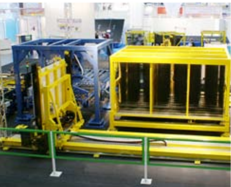
Navette de chargement pour le remplissage du SortJet