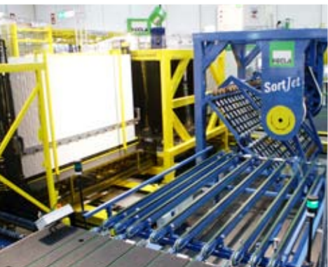
Convoyeur pivotant pour le redressement des verres et le changement de surface