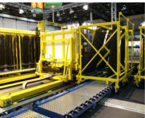
Remplissage des chariots compartimentés dans l'ordre de la production